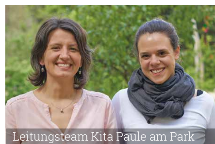
Leitungsteam Kita Paule am Park