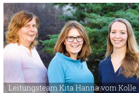
Leitungsteam Kita Hanna vom Kolle