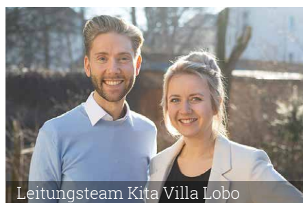
Leitungsteam Kita Villa Lobo