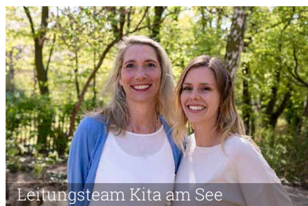
Leitungsteam Kita am See