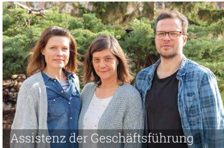
Assistenz der Geschäftsführung