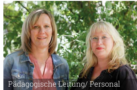
Pädagogische Leitung/ Personal