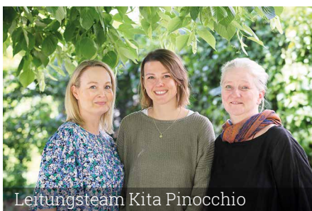
Leitungsteam Kita Pinocchio