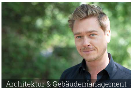
Architektur & Gebäudemanagement