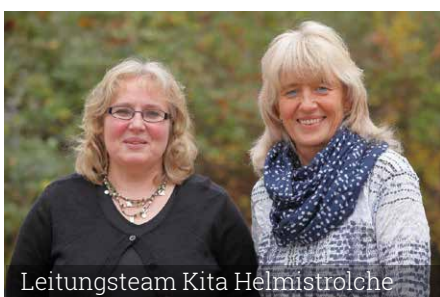
Leitungsteam Kita Helmistolche