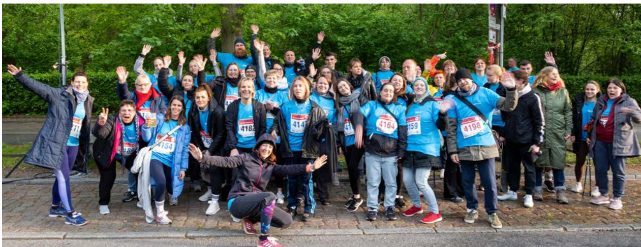
FIRMENLAUF 2024 mit über 70 angemeldeten HANNA - Teilnehmer*innen (nicht Alle im Bild ;-))