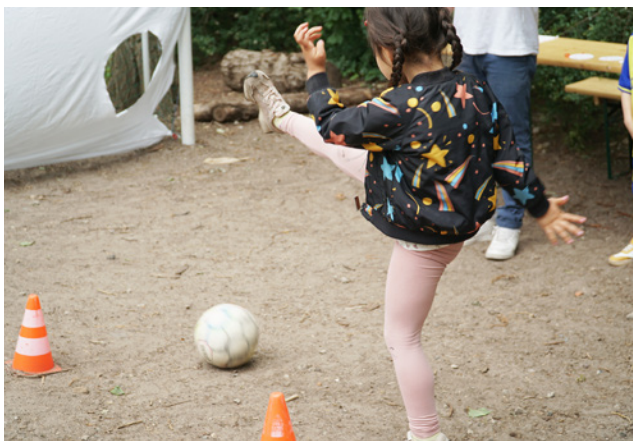
Gut geschossen bei der Hanna vom Kolle Olympiade