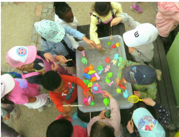
Paule am Park

Mehr zum Prospekt des Kulturgartens siehe QR-Code.